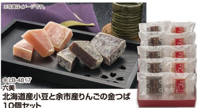
※写真はイメージです。 ◎LB-4817 六美 北海道産小豆と余市産りんごの金つば 10個セット 本体価格 3,800円 (税込 4,104円 )