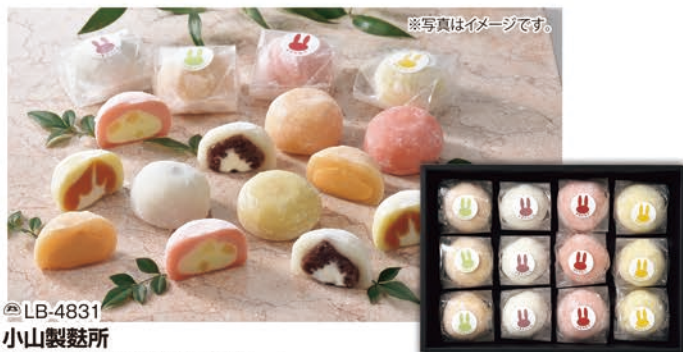
※写真はイメージです。 ◎LB-4831 小山製菓所 ふわふわ大福12個セット 本体価格 4,800円 (税込 5,184円 )