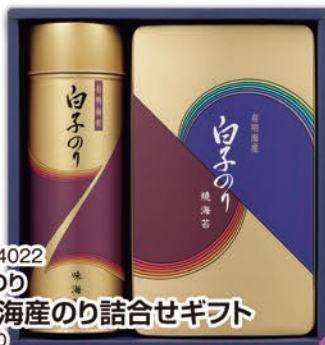
◎ LA-4022 白子のり 有明海産のり詰合せギフト NF-250 本体価格 2,500円 (税込 2,700円 ) のし 名入れ可

イギリス風ビーフカレー(中辛)/190g×2、フランス風ビーフカレー(甘口)・インド風チキンカレー(辛口)・メモリアルリッチ鴨カレー(甘口)各190g 1ケース12個入