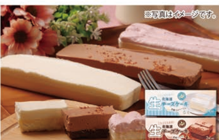
※写真はイメージです。 ◎LB-4819 菊の家 北海道生チーズケーキ3種セット 本体価格 4,800円 (税込 5,184円 )

北海道生チーズケーキ芳醇フロマージュ・北海道生チーズケーキ濃密ショコラ・北海道生チーズケーキ雪下いちご/各1個