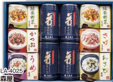
◎ LA-4025 大森屋 舞すがたシリーズ NTF-40G 本体価格 4,000円 (税込 4,320円 ) のし 名入れ可

かにぶりかけ/(4.0g×8袋)、うにぶりかけ/(4.0g×8袋)、焼鮭ほくし/(50g)、たらこほくし/(50g)、鶏そぼろ/(50g) 1ケース6個入