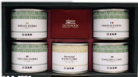
◎ LA-4021 五島軒 五島軒カレー5缶セット GKT-40S 本体価格 5,200円 (税込 5,616円 ) のし 名入れ可

イギリス風ビーフカレー(中辛)/190g×2、フランス風ビーフカレー(甘口)・インド風チキンカレー(辛口)・パンプキンポタージュ各190g 1ケース12個入