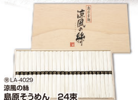
◎ LA-4029 涼風の糸 島原そうめん 24束 CD-30 本件 価格 3,000円 (税込 3,240円 ) のし 名入れ可