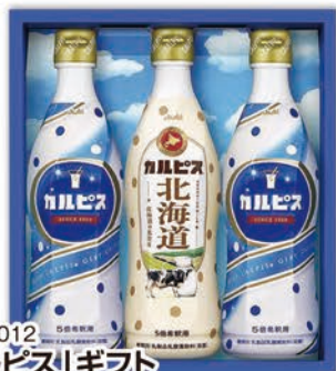
◎ LA-4012 「カルピス」ギフト CN15P 本件 価格 1,500円 (税込 1,620円 ) のし 名入れ可

ピーチブレンド160g×8、マンゴブレンド・アップル・グレープ・ハインアップルブレンド/各160g×4 1ケース4個入