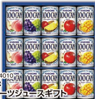
◎ LA-4010 カゴメ フルーツジュースギフト FB-20G 本件 価格 2,000円 (税込 2,160円 ) のし 名入れ可

野菜生活100オリジナル/160g×6、野菜生活100ベリーサラダ、野菜生活100マンゴーサラダ/各160g×2、ピーチブレンド160g×3、ハインアップルブレンド・グレープ/各160g×1 1ケース4個入