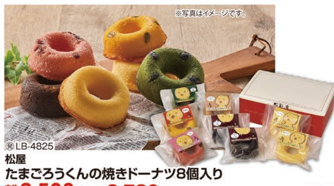
※写真はイメージです。 ◎LB-4825 松屋 たまごろうくんの焼きドーナツ8個入り 本体価格 3,500円 (税込 3,780円 )

たまごろうくんの焼きドーナツ(プレーン・チョコ&くるみ)/各2個、たまごろうくんの焼きドーナツ(ベリーベリー・かぼちゃ・抹茶&黒豆・キャラメル&アーモンド)/各1個