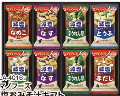
◎ LA-4016 アマノフーズ 減塩おみそ汁ギフト 300G 本件 価格 3,000円 (税込 3,240円 ) のし 名入れ可

いつでも新鮮 しほりたて生しょうゆ・超特選 極旨しょうゆ・塩分ひかえめ丸大豆生しょうゆ/各450ml×2本 1ケース3個入