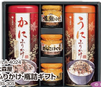
◎ LA-4024 大森屋 ぶりかけ・瓶詰ギフト FBS-30S 本体価格 3,000円 (税込 3,240円 ) のし 名入れ可

信州わさび使用わさびのり(8切5枚)×4袋、濃厚味付のり(8切5枚)×4袋、丸大豆醤油味のり(8切5枚)×4袋、紀州梅使用うめ味のり(8切5枚)×4袋 1ケース10個入