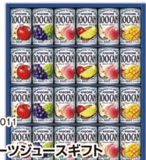
◎ LA-4011 カゴメ フルーツジュースギフト FB-30H 本件 価格 3,000円 (税込 3,240円 ) のし 名入れ可

アップル・ピーチブレンド・マンゴブレンド・グレープ・ハインアップルブレンド/各160g×3 1ケース4個入