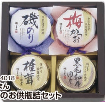
◎ LA-4018 磯じまん ご飯のお供瓶詰セット MT-20 本体価格 2,000円 (税込 2,160円 ) のし 名入れ可

同一箇所に送る場合、1ケースは上記の送料でお送り出来ます。2ケース以上の場合、ケース数×送料となります。※店舗での引き取りは無料。