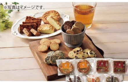
※写真はイメージです。 ◎LB-4816 六美 北海道クッキーアソート 本体価格 3,900円 (税込 4,212円 )

チョコチップクッキー・アーモンドクッキー・ココナッツクッキー・紅茶クッキー・ごまクッキー/各6枚入×1袋、ガレット/2個、フロランタン/2個