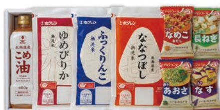
◎ LA-4017 味彩 旬彩米ギフト HH-C 本件 価格 4,500円 (税込 4,860円 ) のし 名入れ可

(合計24食)減塩いつものおみそ汁(なす、ほうれん草)×各6食、(なめこ、とうふ、長ねぎ、赤だし)×各3食 1ケース10個入