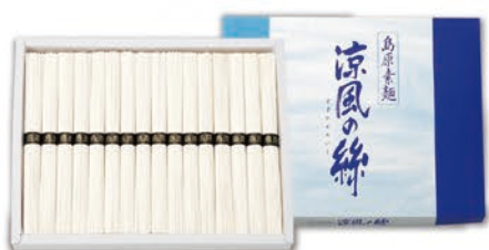
◎ LA-4028 涼風の糸 島原そうめん 16束 C-20 本件 価格 2,000円 (税込 2,160円 ) のし 名入れ可