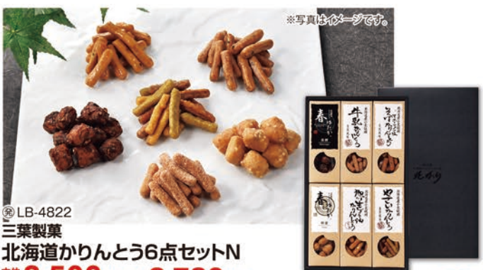
※写真はイメージです。 ◎LB-4822 三葉製菓 北海道かりんとう6点セットN 本体価格 3,500円 (税込 3,780円 )

天然酵母かりんとう春ゆたか(黒糖・蜂蜜)・牛乳かりんとう・旭川生しょう油かりんとう・そばかりんとう・やさいかりんとう/各70g