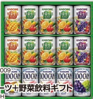
◎ LA-4009 カゴメ フルーツ+野菜飲料ギフト KSR-20H 本件 価格 2,000円 (税込 2,160円 ) のし 名入れ可

同一箇所に送る場合、1ケースは上記の送料でお送り出来ます。2ケース以上の場合、ケース数×送料となります。※店舗での引き取りは無料。