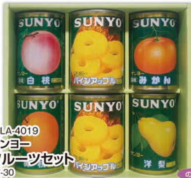
◎ LA-4019 サンヨー フルーツセット SF-30 本体価格 3,000円 (税込 3,240円 ) のし 名入れ可

磯のり/90g、梅かつお/90g、黒毛和牛肉みそ/90g、椎茸ふくめ煮/85g 1ケース8個入