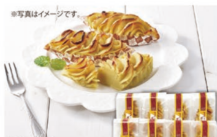
※写真はイメージです。 ◎LB-4818 六美 スイートポテト8個入り 本体価格 5,000円 (税込 5,400円 )