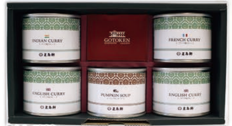
◎ LA-4020 五島軒 五島軒カレー&ポタージュ5缶セット GKT-30S 本体価格 4,100円 (税込 4,428円 ) のし 名入れ可

バインアップル/3号缶×2缶、黄桃/4号缶、みかん/4号缶、白桃/4号缶、洋梨/4号缶 計6缶 1ケース4個入