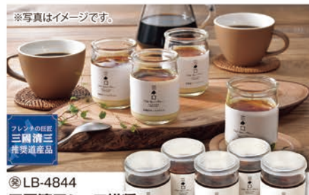
※写真はイメージです。 フレンチの巨匠 三國清三 推奨道産品 ◎LB-4844 三國清三シェフ推奨 北海道クリームブリュレセット MMC-5 本体価格 3,600円 (税込 3,888円 )