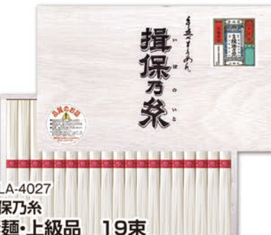
◎ LA-4027 揖保乃糸 素麺・上級品 19束 GS30 本件 価格 3,000円 (税込 3,240円 ) のし 名入れ可