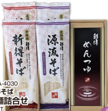
◎ LA-4030 新得そば 乾麺詰合せ Y-25T 本体価格 2,500円 (税込 2,700円 ) のし 名入れ可

味のり/(10切32枚)6個、緑黄野菜ぶりかけ/(2.5g×10袋)、かつおぶりかけ・さけぶりかけ・しらすぶりかけ/(各2.5g×10袋)、さけ茶漬/(6.4g×6袋)、わさび茶漬/(5.6g×6袋) 1ケース6個入