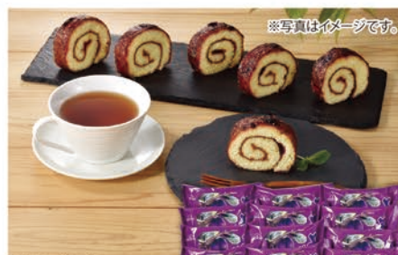
※写真はイメージです。 ◎LB-4824 三星 よいとまけハスカップ1切れ(12個入り) 本体価格 4,000円 (税込 4,320円 )