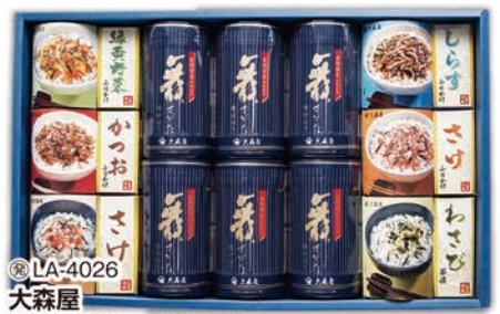
◎ LA-4026 大森屋 舞すがたシリーズ NTF-50G 本体価格 5,000円 (税込 5,400円 ) のし 名入れ可

味のり(10切32枚)4個、緑黄野菜ぶりかけ(2.5g×10袋)2箱、かつおぶりかけ・さけぶりかけ/(各2.5g×10袋)、うめ茶漬(6.0g×6袋)、わさび茶漬(5.6g×6袋) 1ケース6個入