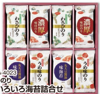
◎ LA-4023 白子のり 味いろいろ海苔詰合せ MR-300 本体価格 3,000円 (税込 3,240円 ) のし 名入れ可

信州わさび使用わさびのり(8切5枚)×4袋、濃厚味付のり(8切5枚)×4袋、丸大豆醤油味のり(8切5枚)×4袋、紀州梅使用うめ味のり(8切5枚)×4袋 1ケース10個入