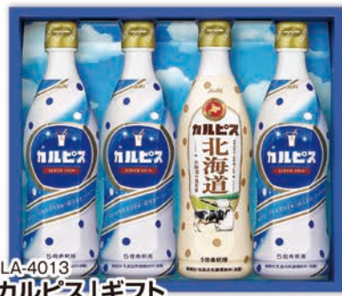
◎ LA-4013 「カルピス」ギフト CN20P 本件 価格 2,000円 (税込 2,160円 ) のし 名入れ可