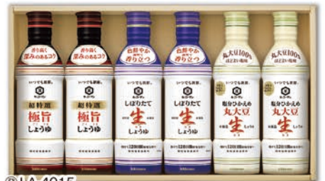
◎ LA-4015 キッコーマン いつでも新鮮ギフトセット KIS-20N 本件 価格 2,000円 (税込 2,160円 ) のし 名入れ可

いつでも新鮮 しほりたて生しょうゆ・超特選 極旨しょうゆ・塩分ひかえめ丸大豆生しょうゆ/各450ml×2本 1ケース3個入