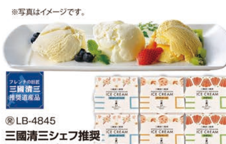
※写真はイメージです。 フレンチの巨匠 三國清三 推奨道産品 ◎LB-4845 三國清三シェフ推奨 北海道プレミアムアイス 3種セット(6個) MNA-R 本体価格 5,300円 (税込 5,724円 )

三國推奨北海道プレミアムアイス(カスタード/バニラ・ダブルチーズ・かぼちゃ)/各100ml×2