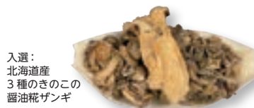
入選：北海道産3種のきのこの醤油糀ザンギ