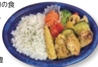
優秀賞：ハニーマスタードチキンプレート

開発においては、北海道産や旬の食材の活用に加え、健康志向に応える調理法の追求や食感へのこだわりなど、独自の創意工夫を凝らしております。今回の受賞を励みに、今後もお客様の健康で豊かな食卓を支える商品開発に努めてまいります。