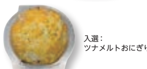
入選：ツナメルトおにぎり