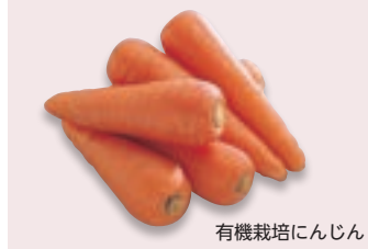
有機栽培にんじん