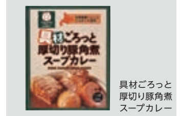
具材ごろっと厚切り豚角煮スープカレー