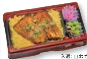
入選：山わさびでいただく羅臼産真ほっけ蒲焼重