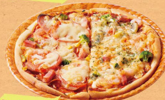
ミックス・エビマヨ